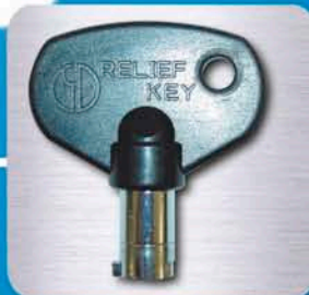
リリースキー(手持ちキー)