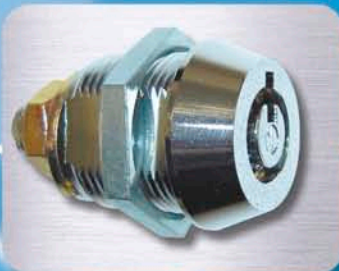
八方錠(メダルサンド他)