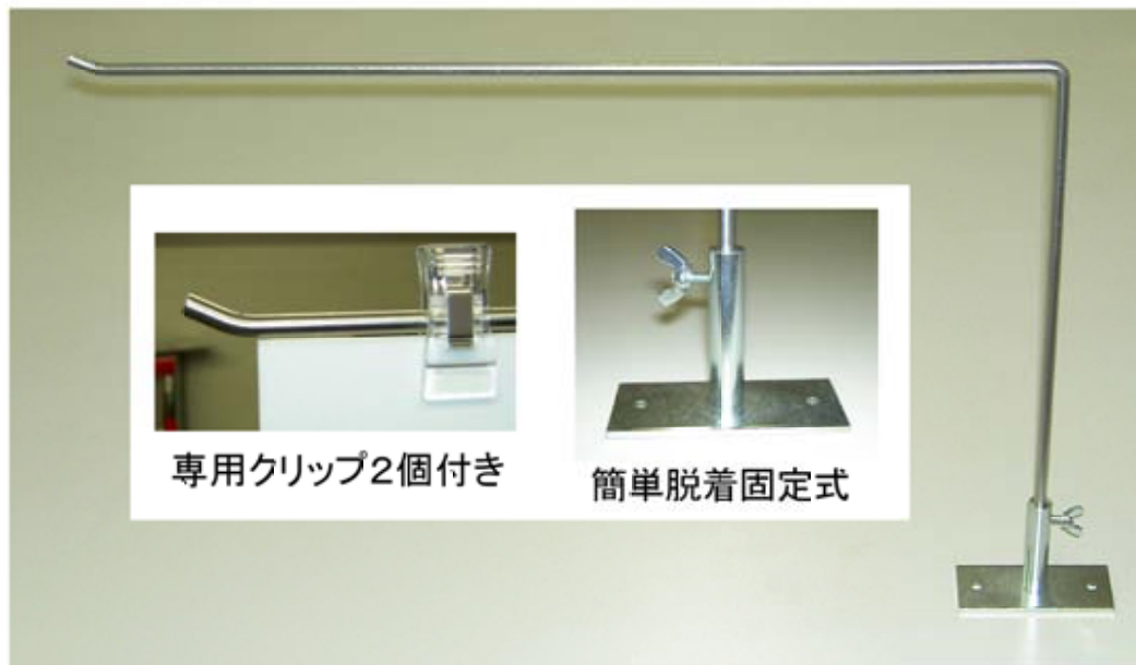
専用クリップ2個付き